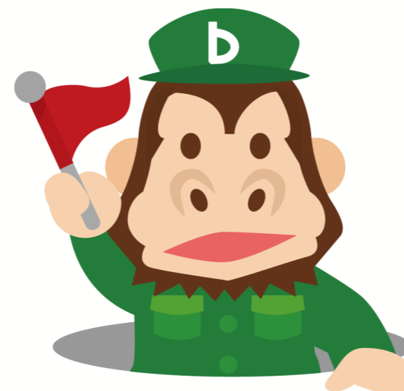
Backlogのキャラクター ゴリットくん